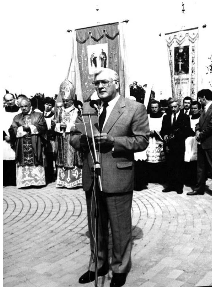
Skulptūros Antanui Baranauskui atidengime dalyvavo Lietuvos Respublikos Prezidentas Algirdas Brazauskas.

- Sunku su kiekvienu darbu atsisveikinti. Žinoma, džiaugiesi, kai atidarymo šventėje sulauki žmonių dėmesio, padėkos. Bet vis tiek į kūrinį žiūri kaip į vaiką, kurį išleidi į gyvenimą, kuris pats turi pradėti savarankišką gyvenimą. Galvoji, ką dar galima būtų buvę patobulinti. Skulptūros įgyvendinimo kūrybinis procesas yra sudėtingas. Kiekvienas