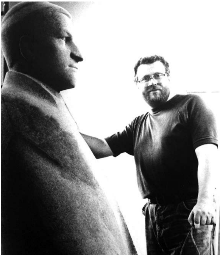
„Gimsta“ Antanas Baranauskas.