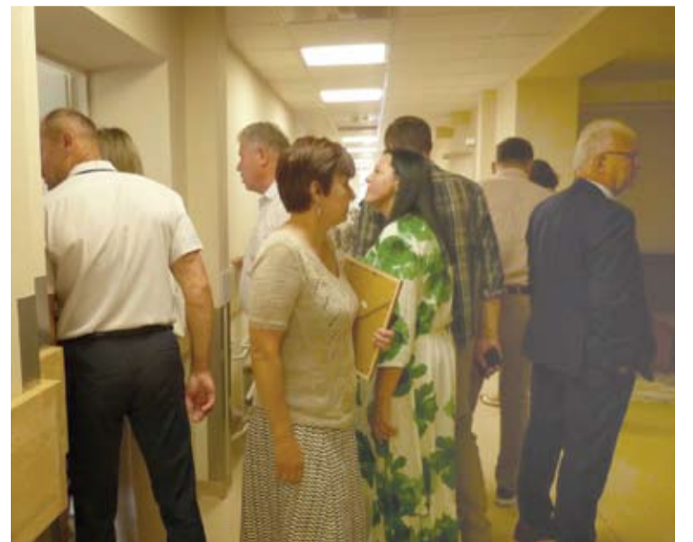
Į renginį susirinkę svečiai apžiūrėjo Troškūnų senelių globos namų patalpas.