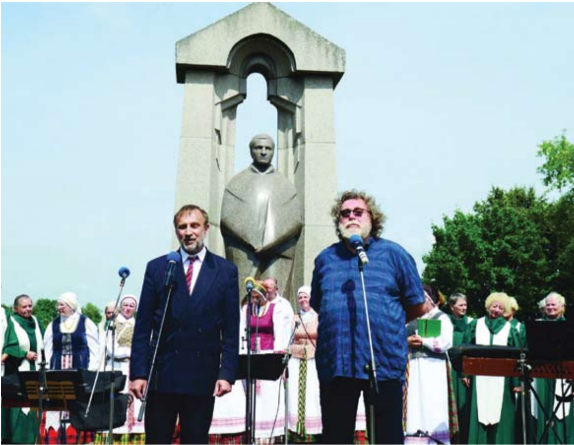
2018-aisiais Anykščiuose surengtas paminklo vyskupui ir poetui Antanui Baranauskui atidengimo 25-mečio minėjimas. Už paminklą skulptorius Artūras Sakalauskas ir architektas Ričardas Krištapavičius buvo apdovanoti Lietuvos nacionaline kultūros ir meno premija.