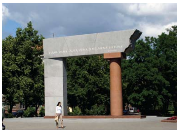
Vienybės arka Klaipėdoje. 2003 metai.