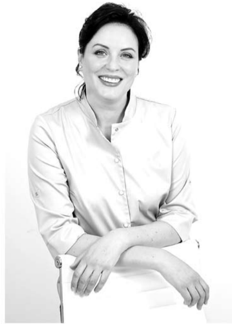
K. Jarienė tvirtina: „Lytinė sveikata – vienas svarbiausių kokybiško gyvenimo veiksnių“.

Šįkart labiau pasisėkė ir Vaižgantiečių klubui „Pragiedrulyš“